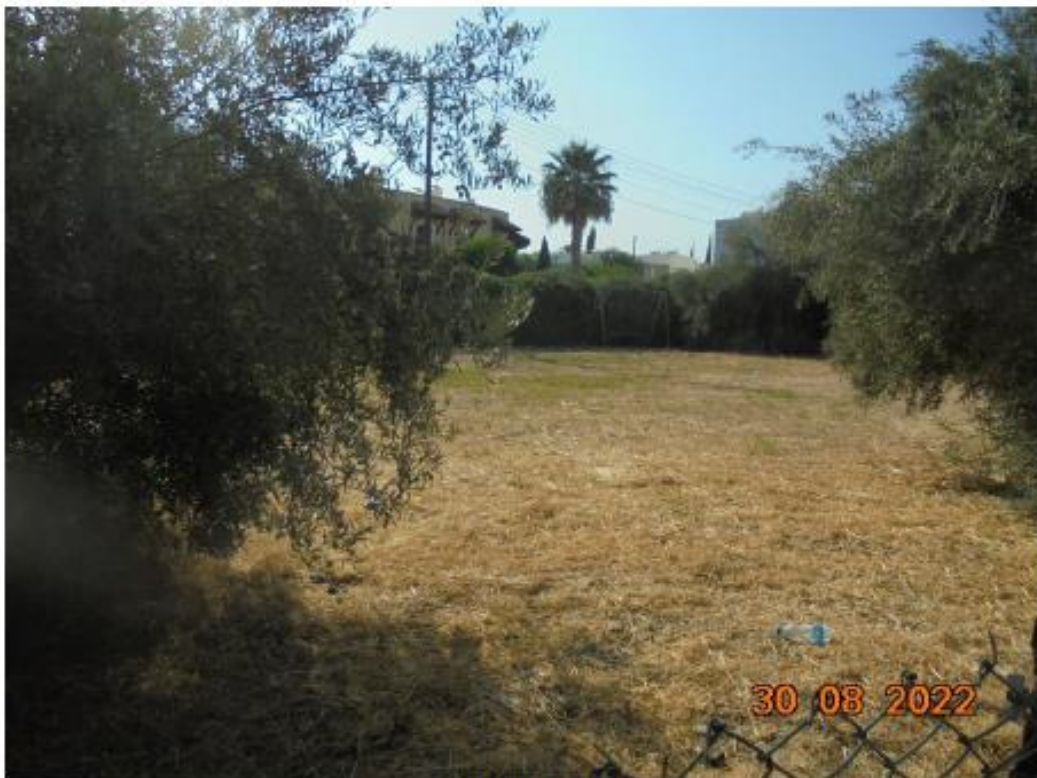
Το τεμάχιο 453.