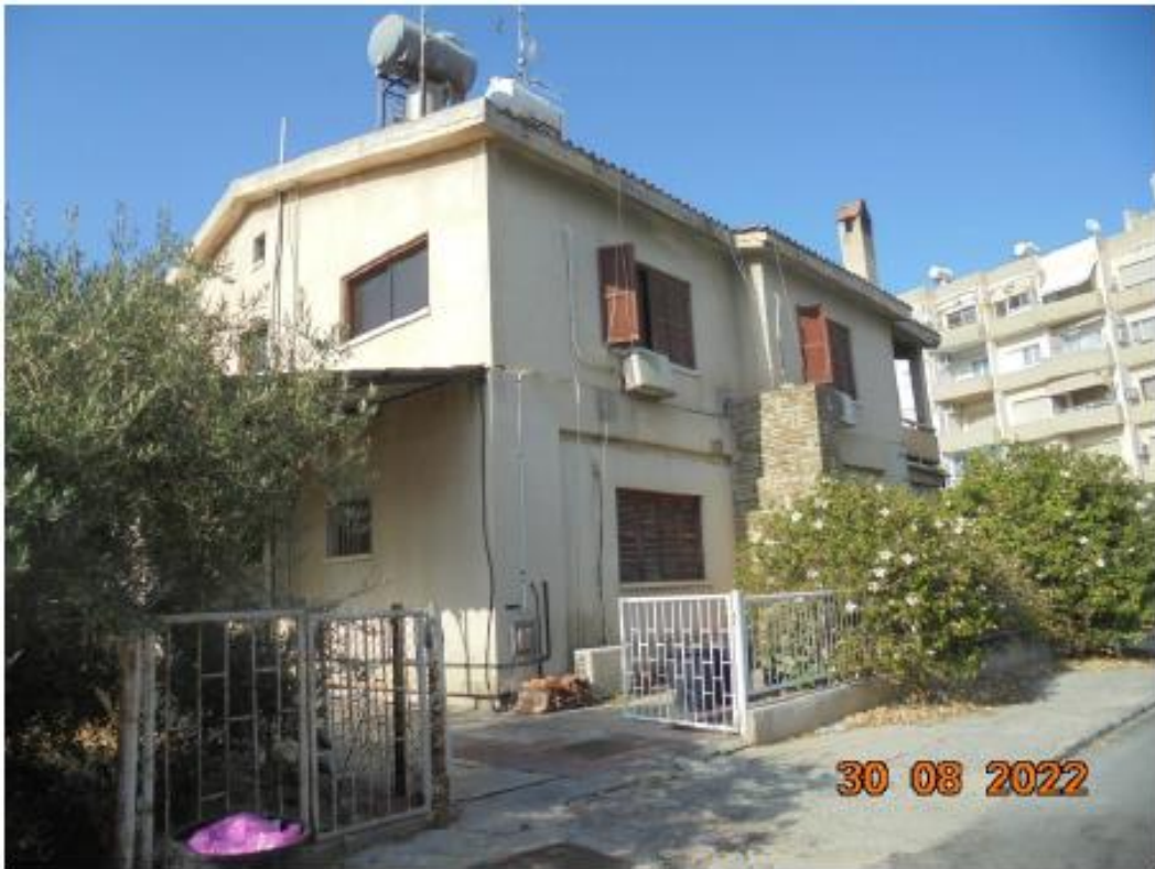
Το κτήριο επί του τεμαχίου 452.