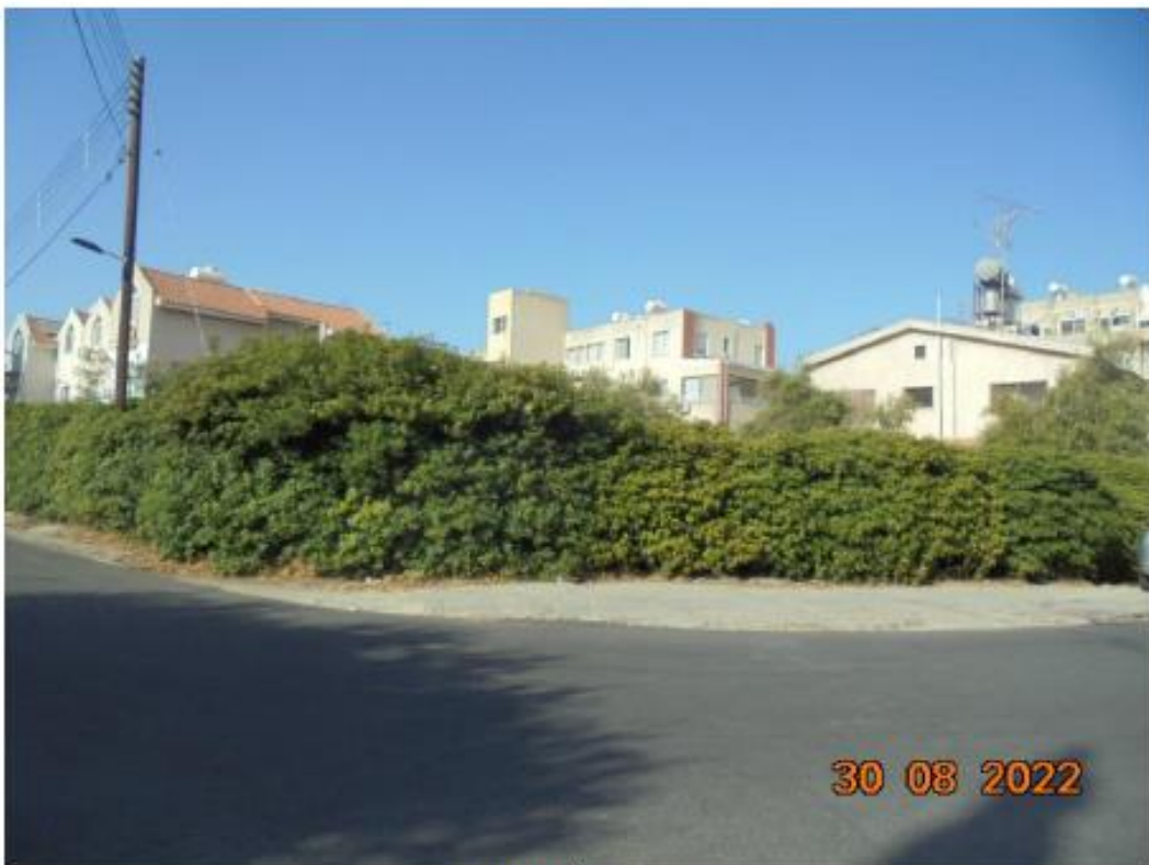
Το τεμάχιο 453.