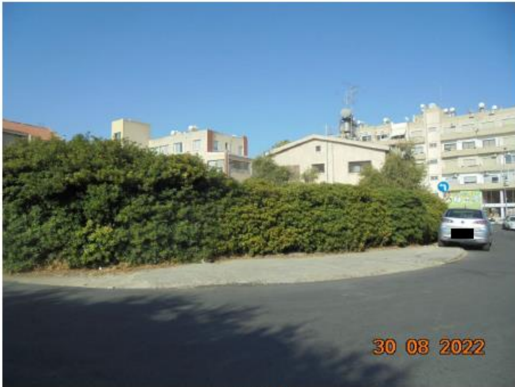
Το τεμάχιο 453.